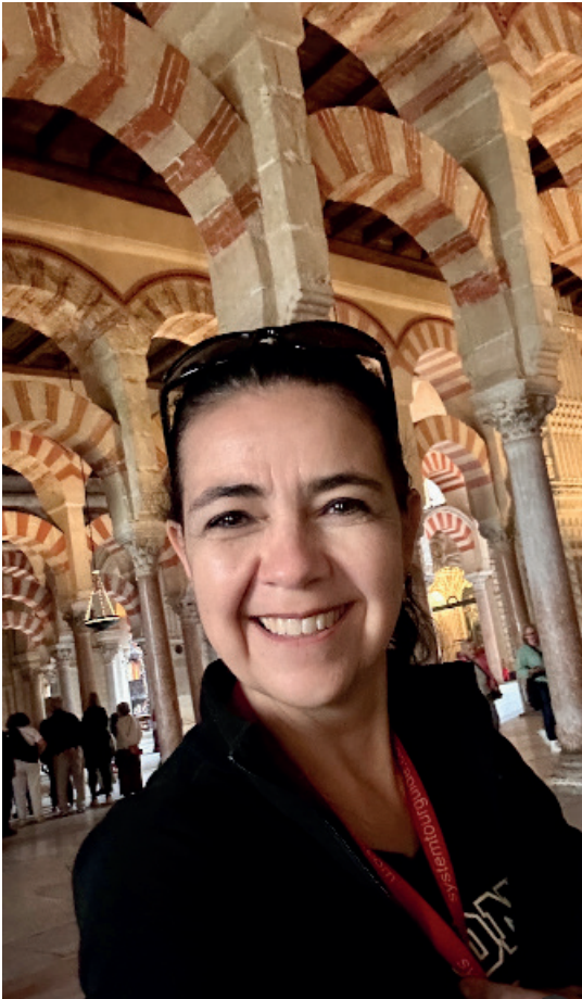
Mezquita Catedral - Córdoba

Katurra Tour se ubica en Mérida, Yucatán y lleva 13 años en el mercado turístico, haciendo felices a diferentes clientes con tours creados a medida, según las necesidades y gustos de cada pasajero.