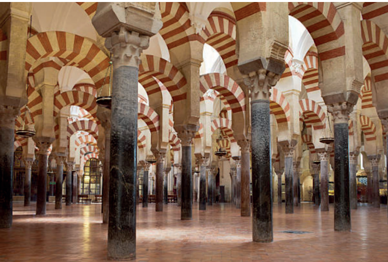
La mezquita catedral de Córdoba

pasearemos por el barrio de la judería para ver la sinagoga y el mercado árabe. Finalizaremos el tour en el interior del Alcázar de los Reyes Cristianos, una de las principales residencias de Isabel I de Castilla y Fernando II de Aragón.