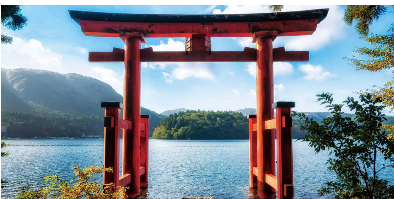
Torii en el lago Ashi en Hakone

Después del desayuno está la opción de ir por el día a Disney Tokio o tomar el tour local a Hakone, un complejo volcánico donde se podrá admirar, si el tiempo lo permite, el Monte Fuji, navegar por el lago Ashi y tomar el teleférico para admirar la naturaleza de Japón. Todo esto a tan sólo 2 horas de la capital! Nos regresamos a Tokyo. Alojamiento