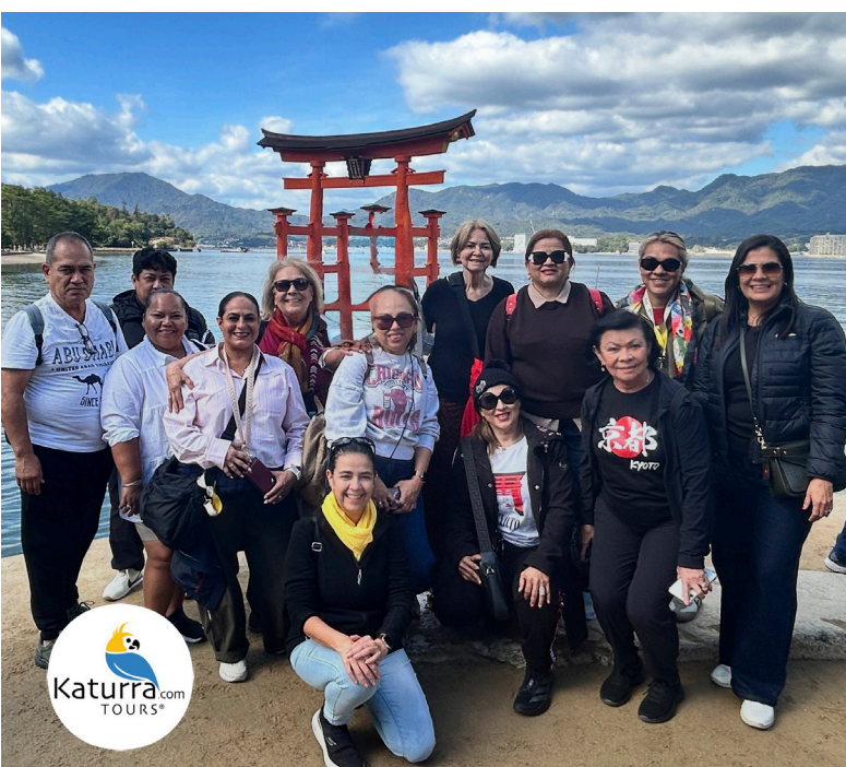
Isla de Miyajima en Hiroshima