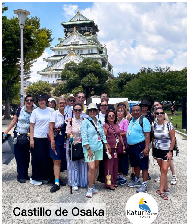
Castillo de Osaka

Después del desayuno iniciamos el recorrido por el Bosque de Bambú, luego iremos a recorrer el Pabellón Dorado, un precioso templo zen que tiene las paredes exteriores de las dos plantas superiores lacadas y recubiertas con pan de oro y para finalizar el día iremos al impresionante Fushimi Inari o sendero rojo y naranja que está compuesto de miles de puertas torii. Este camino se extiende y serpentea a lo largo de la montaña. Regresamos a Kyoto. Alojamiento.