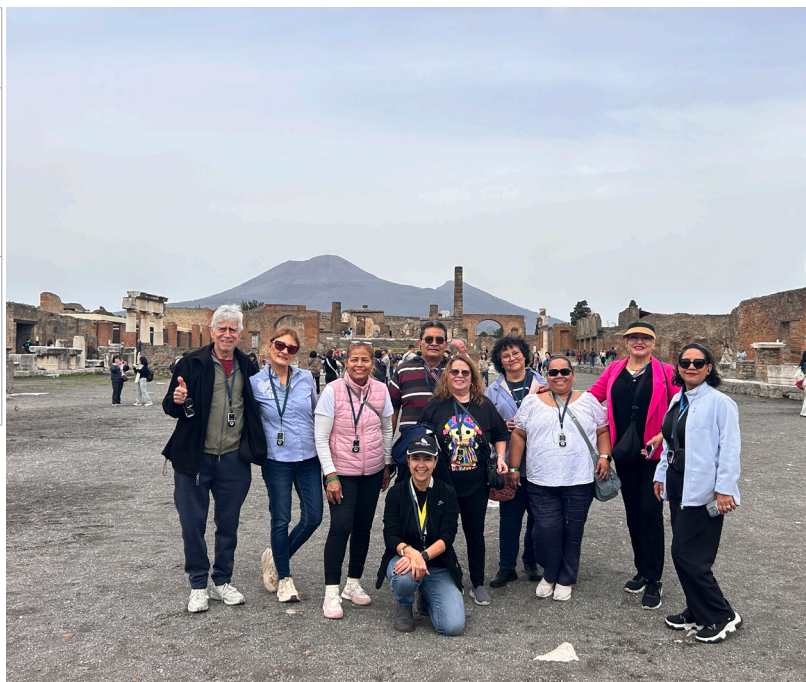
Pompeya - Marzo 2025