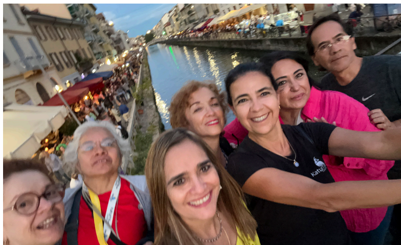
Barrio Navigli - Milán